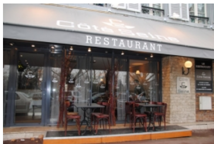
Hébergement - Restauration