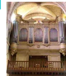
Orgue Cavaillé-Coll -Mutin restauré en 2015

Eglise et orgue classés au titre des Monuments Historiques