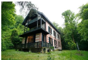
Datcha d'Ivan Tourguéniev

Non accessible aux personnes à mobilité réduite