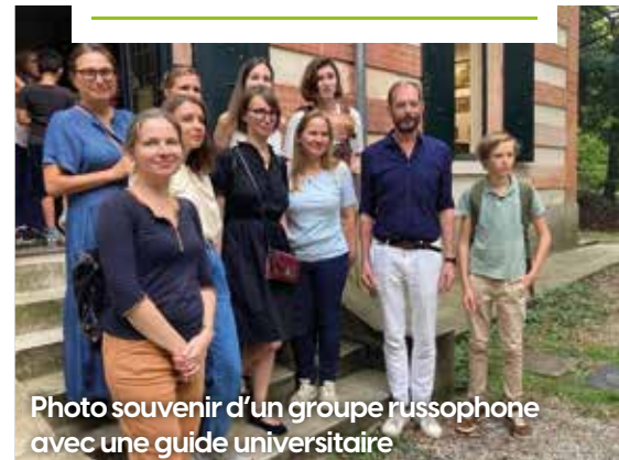
Photo souvenir d'un groupe russophone avec une guide universitaire